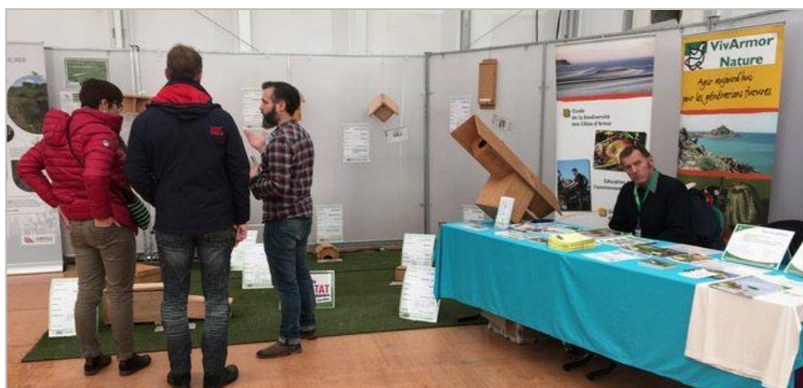
Le stand de VivArmor Nature

Venez nous rencontrer lors du salon de l'Habitat à Lamballe qui se déroulera au Haras national les 10 et 11 novembre prochain !