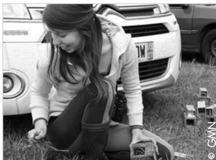
Meggane sur le terrain

Outre ce travail de terrain, l'analyse et le traitement de données (cartographie, statistiques) constituent une part importante de notre activité. Nous établissons ainsi des indices d'activité, nous identifions des points noirs de collisions routières ou encore