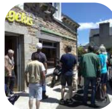
Participer à une action de mobilisation citoyenne.