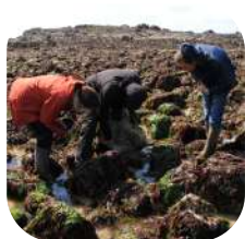
Découverte de la Réserve naturelle de la baie de Saint-Brieuc (richesses et métiers).

Contre un don égal ou supérieur à 1 500 €, nous pouvons organiser une animation de 2 h à plusieurs demi-journées à destination de vos collaborateurs. Ces animations sont créées conjointement selon vos envies et besoins.