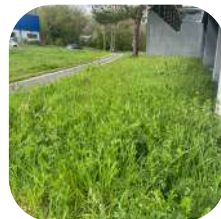
Sensibilisation à la gestion différenciée de vos espaces verts.