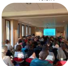
Conférences ou échanges sur diverses thématiques environnementales.