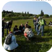
Initiation au naturalisme.