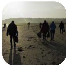
Nettoyage de plage, collecte des déchets & écorando aux côtés des agents de la Réserve.