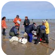
Découverte de la biodiversité littorale et des bonnes pratiques de la pêche à pied de loisir.