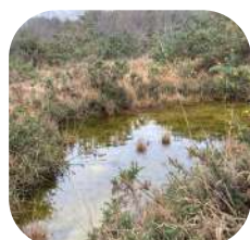
Découverte de la faune et landes de La Poterie.